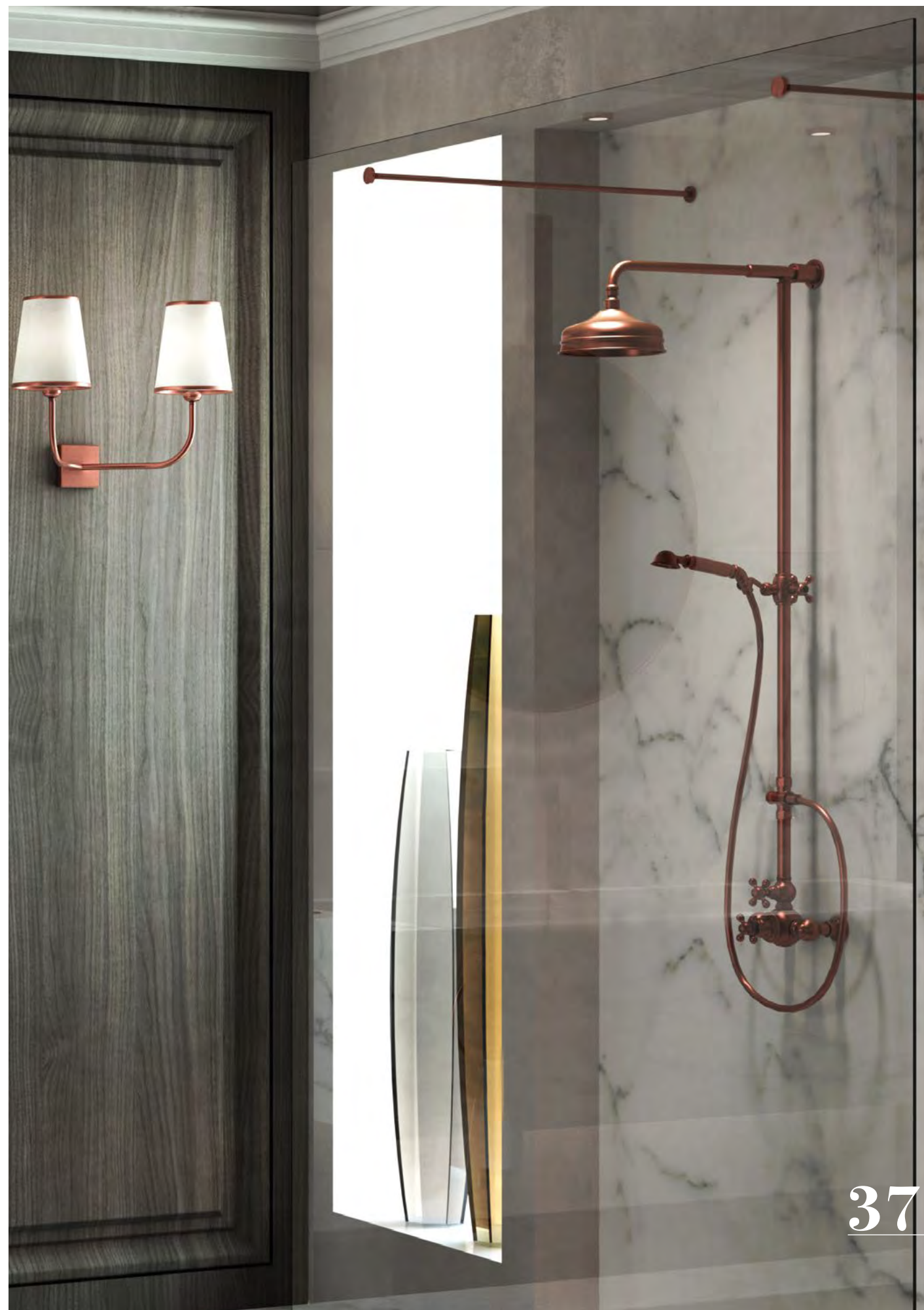
TS 414 CombiVasca Termostatico Thermo CombiBath