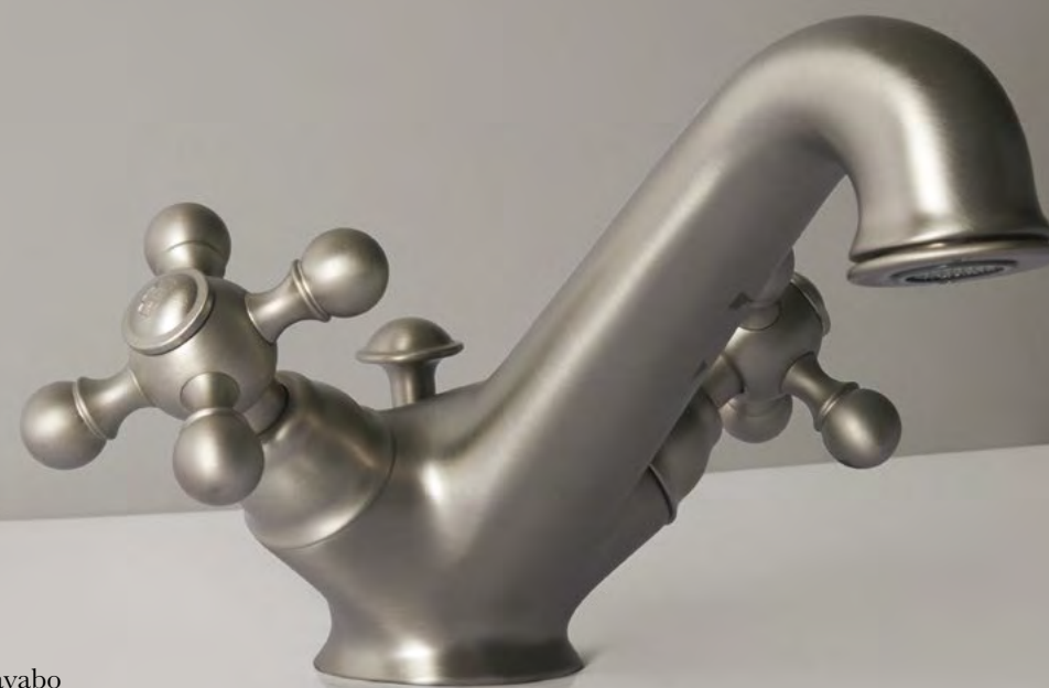
AC 51 Miscelatore Lavabo Basin Mixer