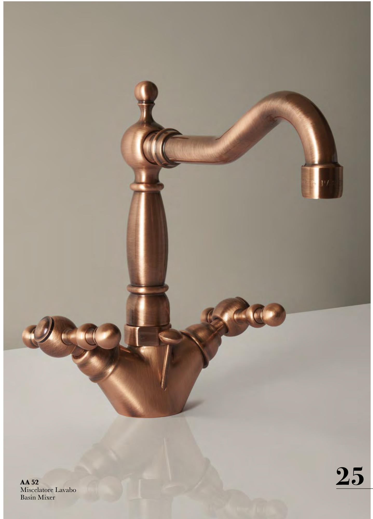
AA 52 Miscelatore Lavabo Basin Mixer