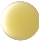
24K Gold 24