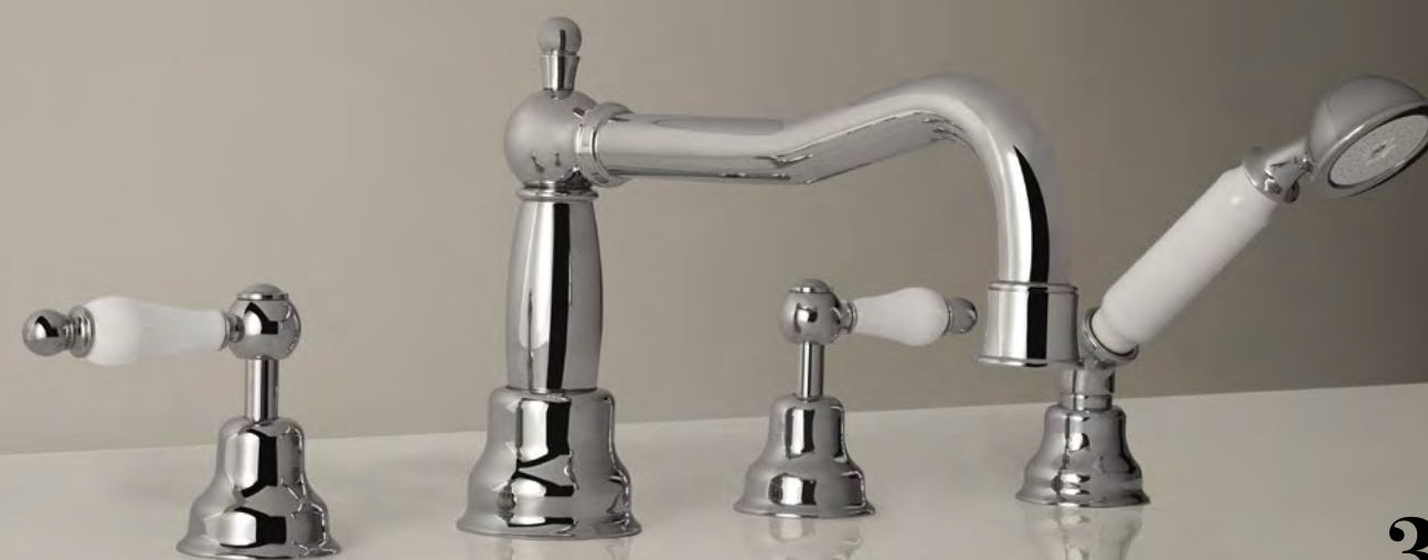
TS 26 Batteria Bordo Vasca Deck Mounted Bath Set