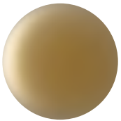
Antique Bronze 27