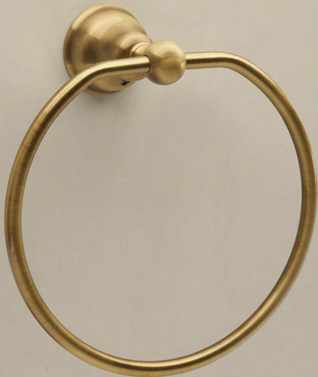
AR 9022 Porta Salviette Towel Ring