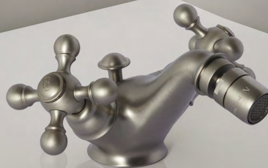
AC 55 Miscelatore Bidet Bidet Mixer