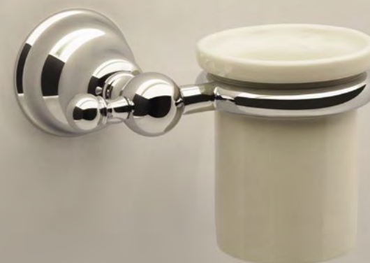
AR 9050 Porta Bicchiere Tumbler Holder