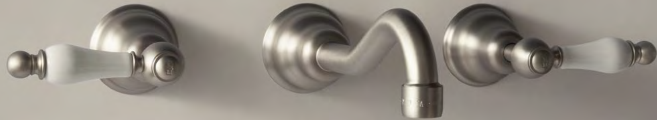
TS 351 Batteria Lavabo Basin Set