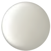
Polished Nickel 2B