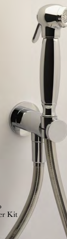
AR 791 Set Idroscopino Shut-Off Shower Kit