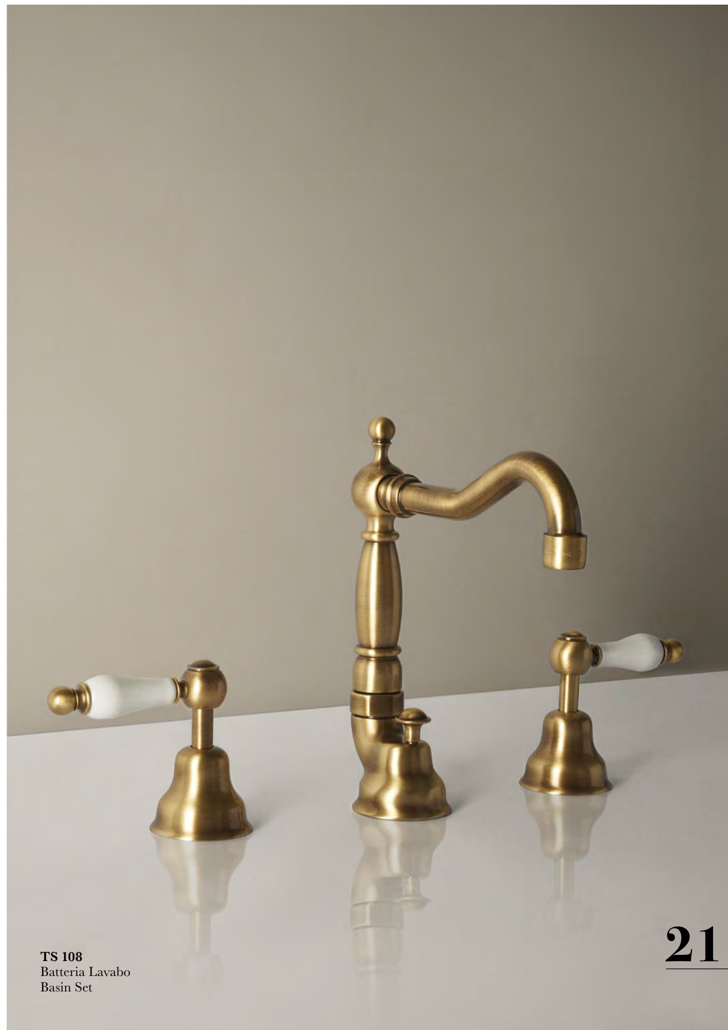
TS 108 Batteria Lavabo Basin Set