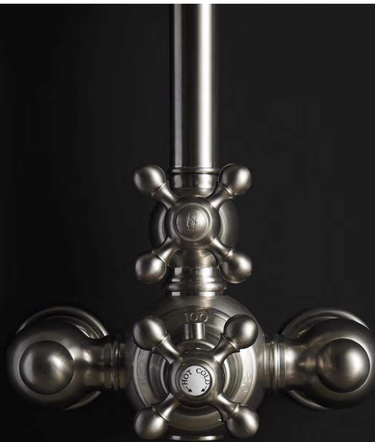
AC 407 CombiDoccia Termostatico Thermo CombiShower