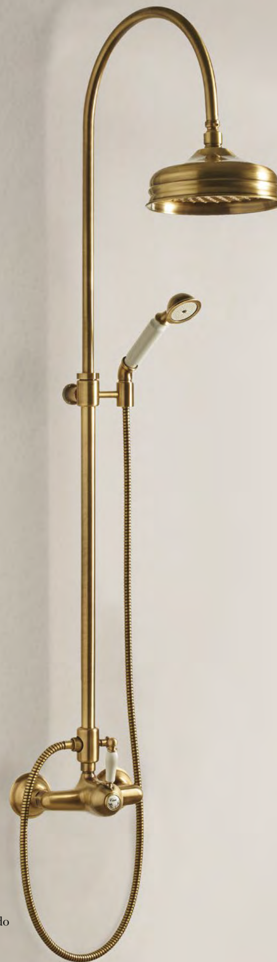
EM 405 CombiDoccia Monocomando CombiShower Mixer