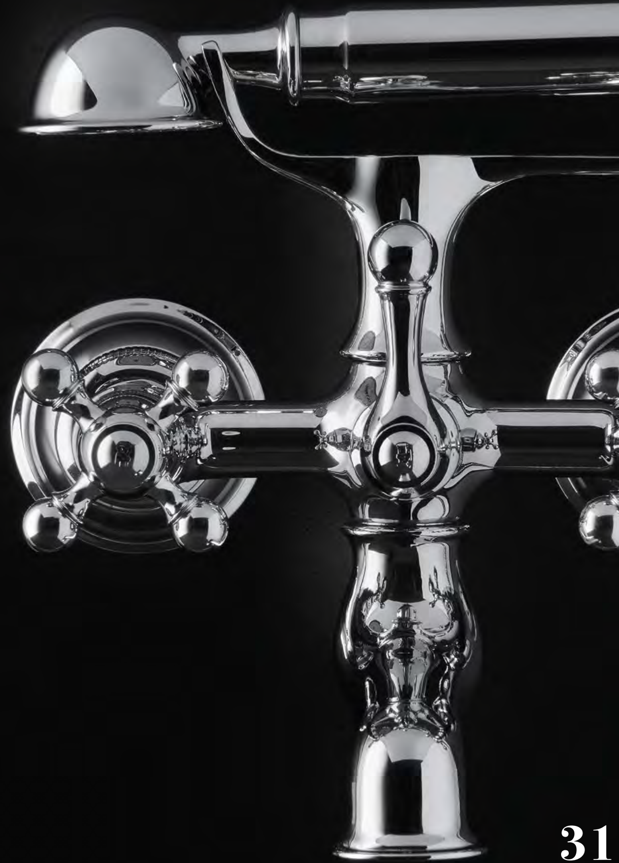
AC 10 Completo Miscelatore Vasca Bath/S. Mixer Set