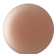
Aged Copper 26