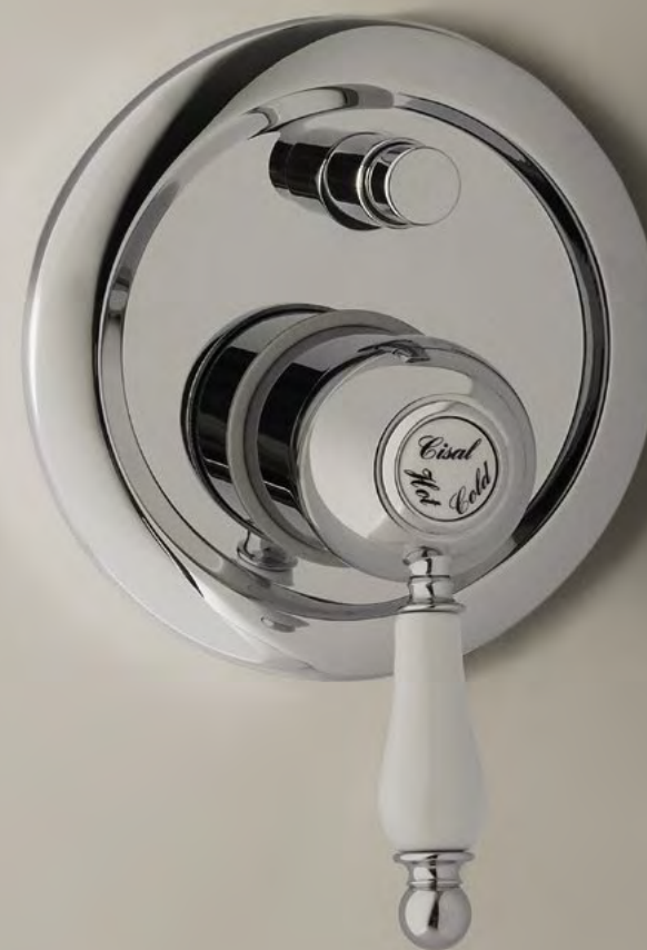
EM 210 Monocomando 2 Uscite 2-Outlet Mixer