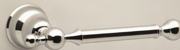
AR 9040 Porta Rotolo Roll Holder