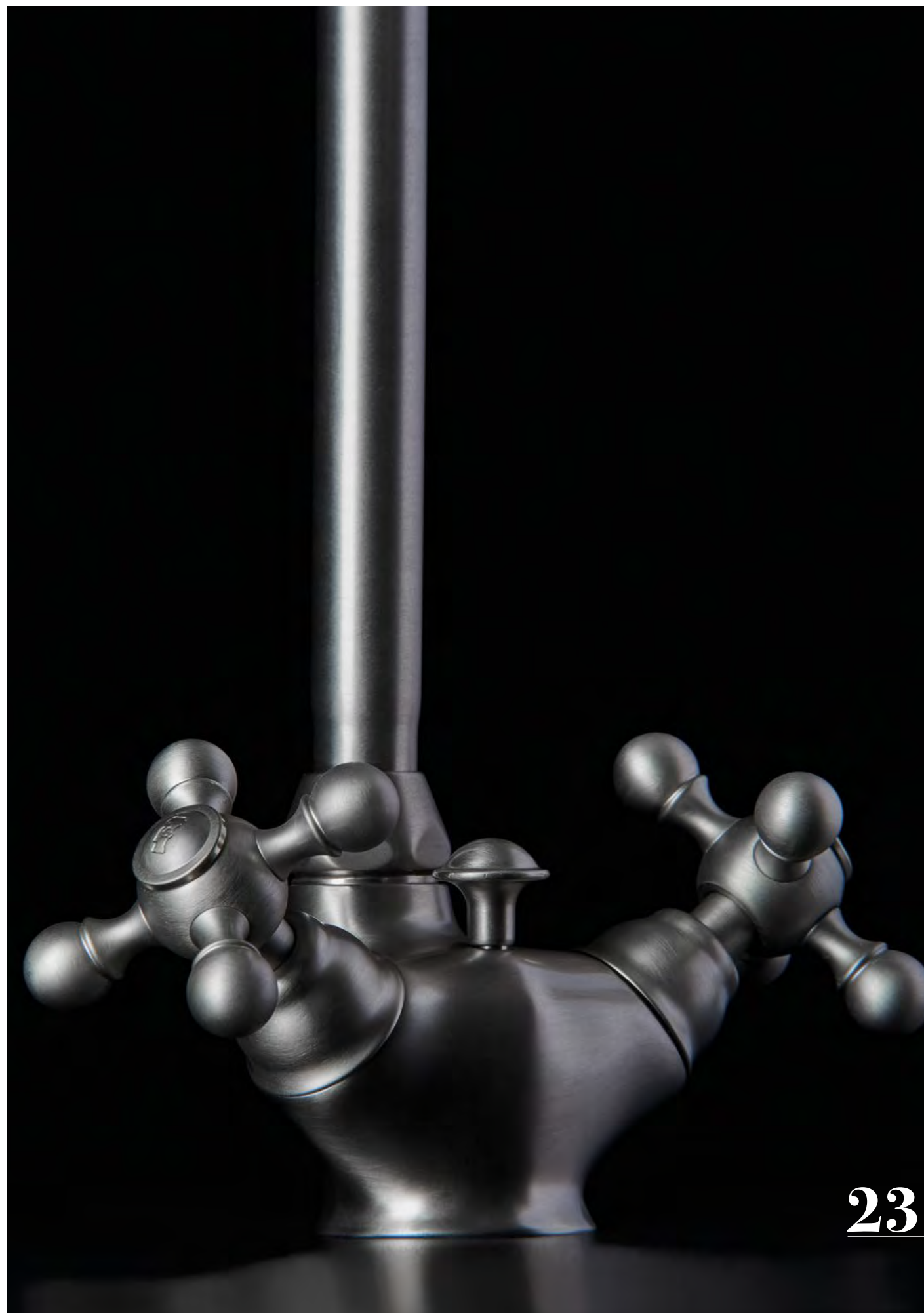
AC 52 Miscelatore Lavabo Basin Mixer