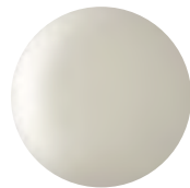
Brushed Nickel 2A